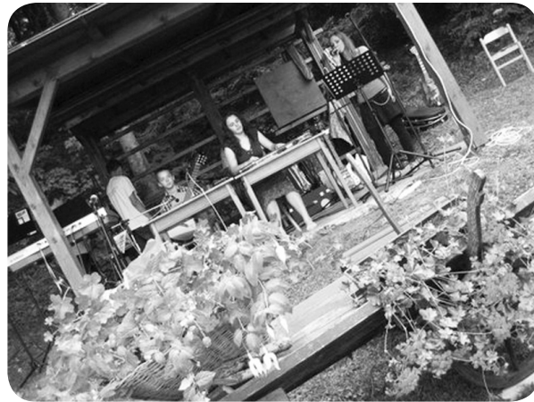
Prizorišče na Kopitniku,