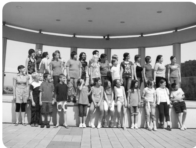
skupinska slika pred Domom svetega Jožefa