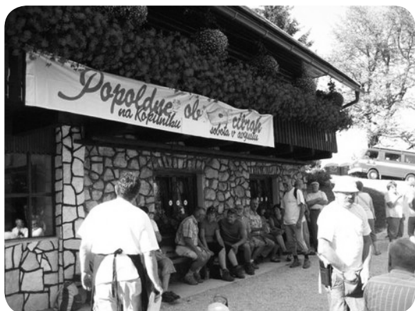
Popoldne ob citrah 2009 na Kopitniku