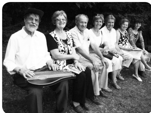
Marjanke z mentorjem in spremljevalcema