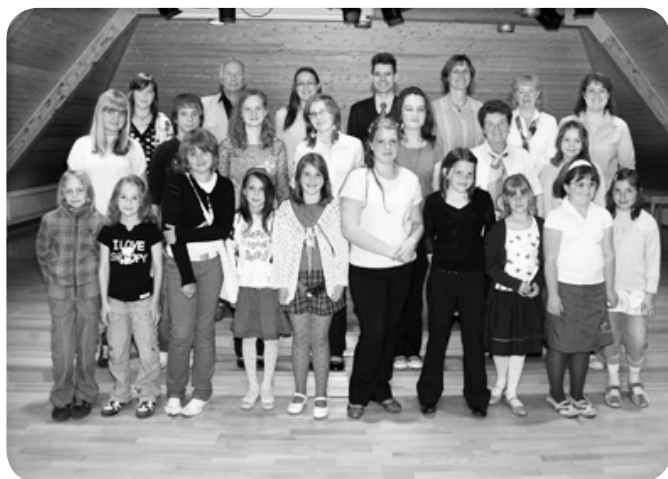
udeleženci srečanja gorenjskih citrarjev

V soboto, 6. junija, so v okviru projekta Poletne prireditve na Stari Savi zazvenele citre. Zazvene so ljudske viže, sodobnejše melodije ter slavna Cvetje v jeseni in Tretji človek.